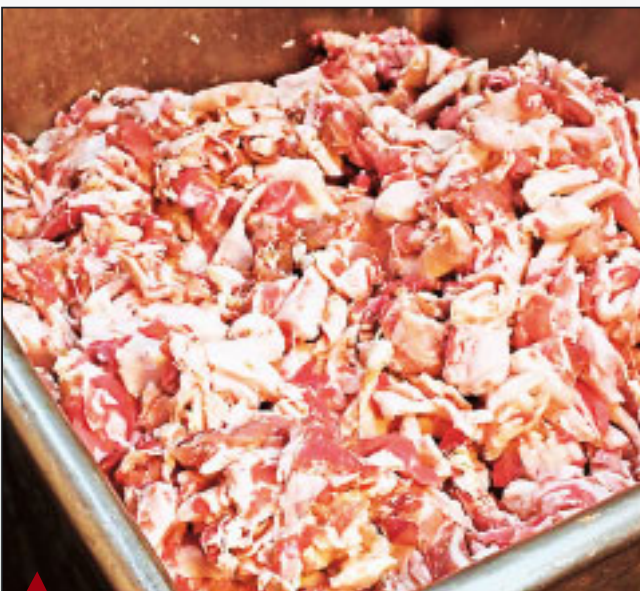
Makkaran pääraaka-aine on liha.